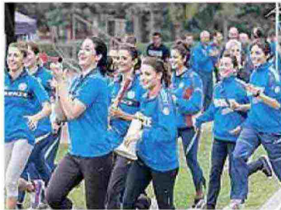
SORRISI La squadra femminile

DA QUESTO fine settimana poi l'Atletica Firenze Marathon ha un nuovo sito internet, realizzato dallo studio Wolf Design di Francesco Rondoni, fotografo ufficiale della società, sul quale si possono trovare tutte le news e le foto delle gare: www.firenzeatletica.it .