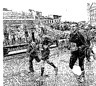
SPORTIVO Il sindaco Matteo Renzi alla maratona dell'anno scorso

ANCHE per quest'anno all'evento del 27 novembre sarà assicurata la diretta televisiva su Rai Sport Sat, ma saranno partner ufficiali e scandiranno il countdown dell'evento (ad oggi mancano 46 giorni al via) anche tre emittenti radiofoniche: Radio 24 a livello nazionale, Lady Radio ed Rdf a livello regionale. Inoltre Toscana Tv dedicherà alla maratona di Firenze almeno due speciali all'interno di «Runners, atletica e podismo in Toscana» nei due giovedì sera successivi alla gara.