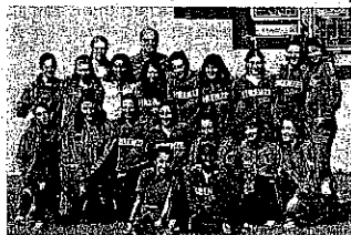
Squadra Comacchio 2011

Se la dovrà vedere con le migliori 12 squadre d'Italia e rappresenterà, fatto storico, la città di Firenze sia in campo maschile che in campo femminile ai vertici dell'atletica nazionale, l'Atletica Firenze Marathon si appresta a vivere un fine settimana molto intenso: sabato e domenica a prossimi sarà a Sulmona (in provincia de l'Aquila) dove prenderà parte con entrambe le proprie squadre (maschile e femminile) alla finale Oro del campionato di società