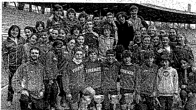
PRIMI A sinistra i Cadetti e le Cadette, nati negli anni 95 e 96, a destra i Ragazzi e le Ragazze, anni 97 e 98